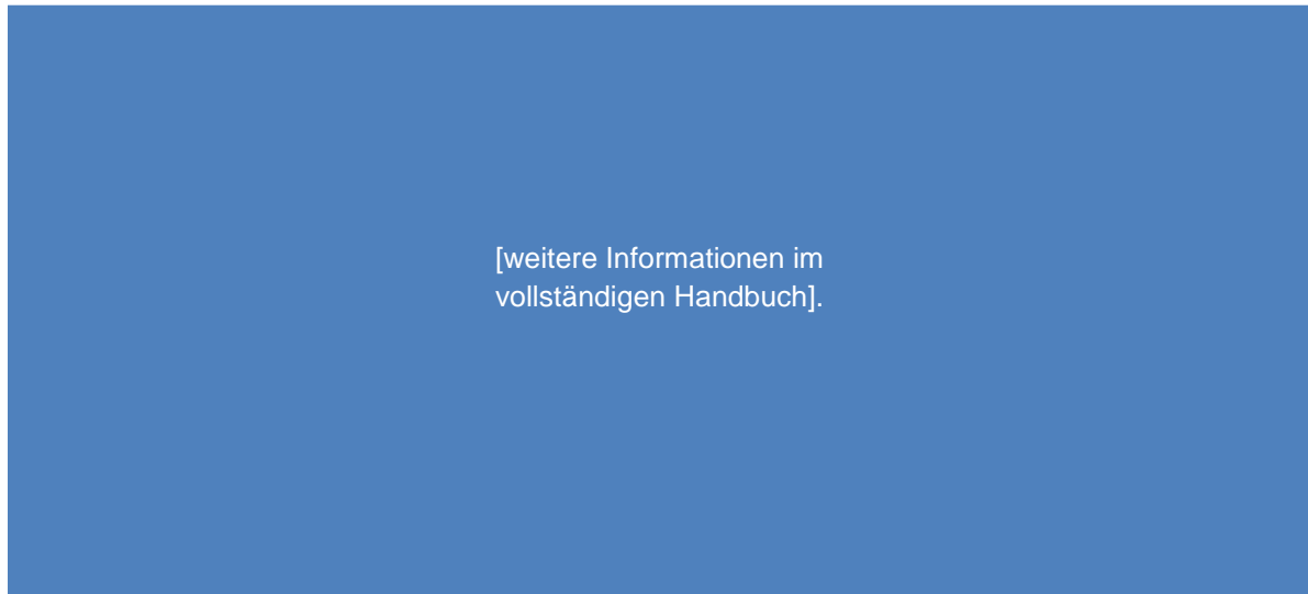
Abbildung 8: [weitere Informationen im vollständigen Handbuch].