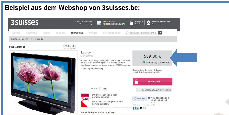
Abbildung 1: [weitere Informationen im vollständigen Handbuch].

Hersteller und Importeure der genannten Geräte sind auch für die Rücknahme und Entsorgung des Verpackungsmaterials zuständig. Der für die Verpackungen Verantwortliche hat die Wahl zwischen (...)