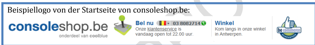
Abbildung 4: [weitere Informationen im vollständigen Handbuch].

[weitere Informationen im vollständigen Handbuch]