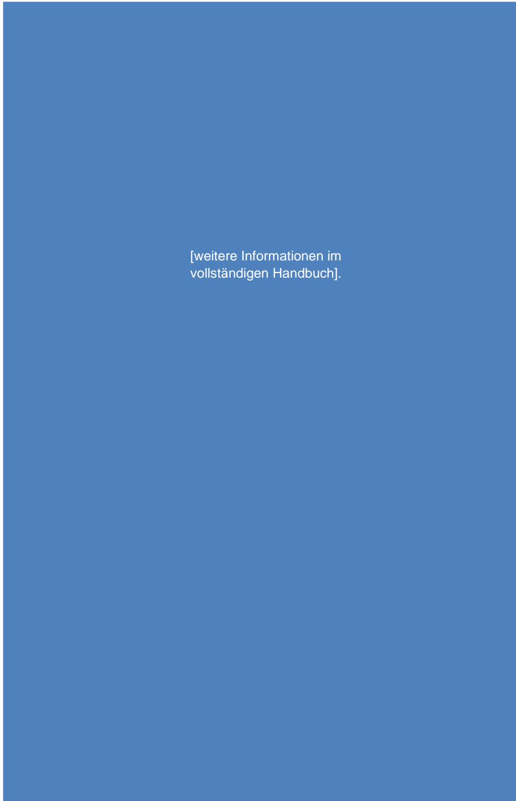
Abbildung 10: [weitere Informationen im vollständigen Handbuch].